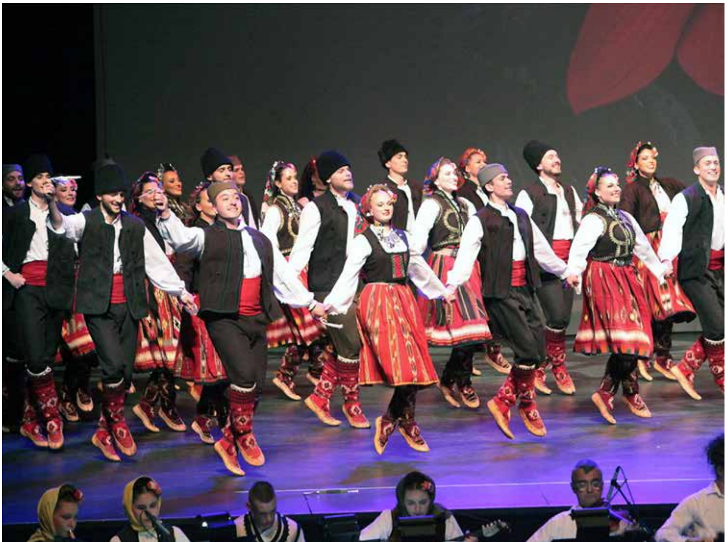
SCA Oplenac Rep Ensemble