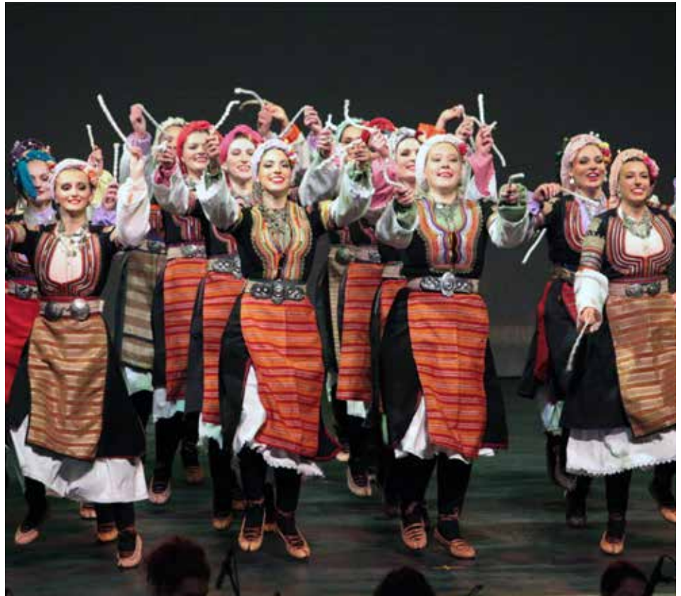
SCA Oplenac Rep Ensemble

Завештање Великог жупана Стефана Немање Српском роду