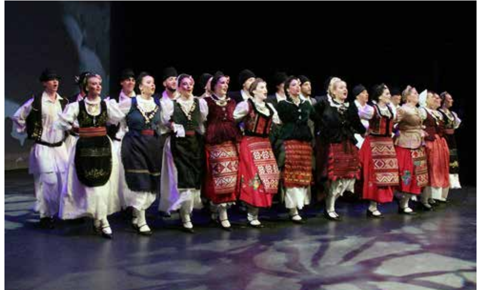
SCA Oplenac Rep Ensemble

Oplenac's strength lies in its work with young people. In a multicultural environment like Toronto, where different identities are everyday life, young people often need a foothold that will